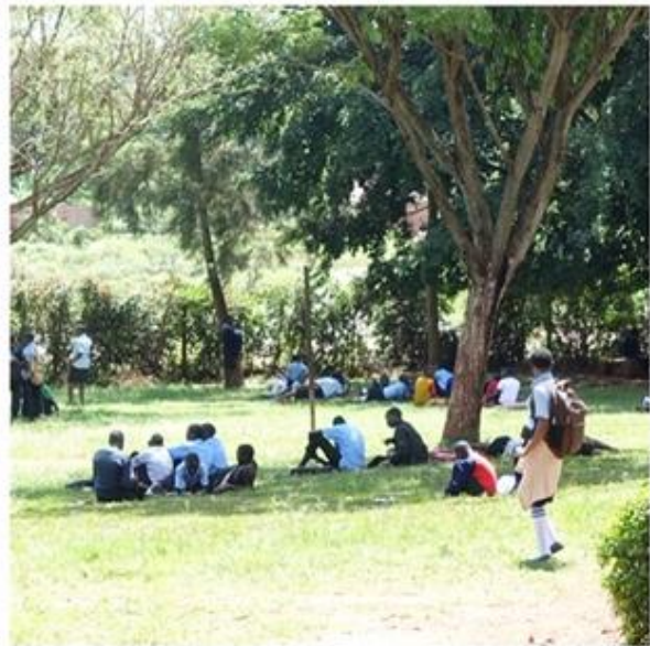
De 17 kinderen op de middelbare school