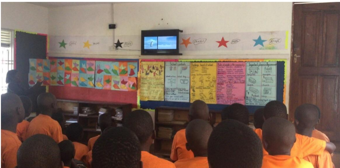
TV-scherm in klaslokaal 2